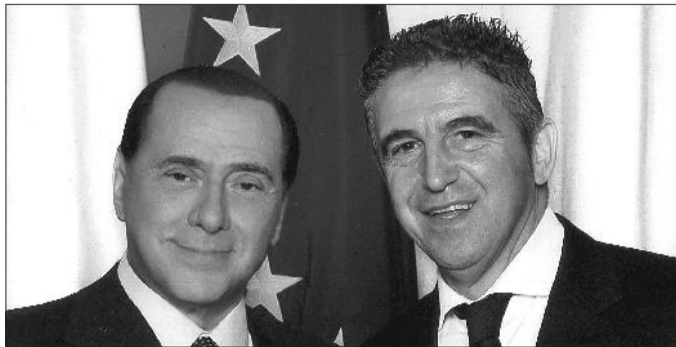
Silvio Berlusconi e Francesco Polidori

"Sì, infatti credo sia necessario aprire una scuola che sforni professionisti preparati nei settori che 'tirano'. Parlo di informatica, automazione ed energia. A Città di Castello si è sviluppata una grande cultura di alta informatizzazione e automazione intorno alle aziende del 'genio' Giuseppe Ponti: sono stati raggiunti risultati che