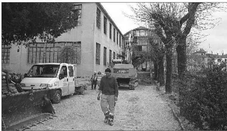
Ex Fat In azione le macchine operatrici per la demolizione